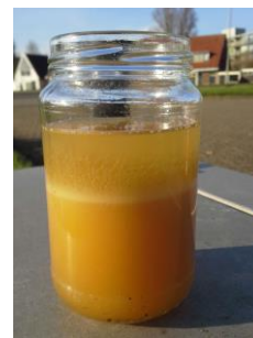
Diesel met microbiologische verontreiniging.

Wanneer de test in een laboratorium wordt uitgevoerd, moet het monster worden behandeld, geconditioneerd en opgeslagen conform de richtlijnen van het laboratorium.