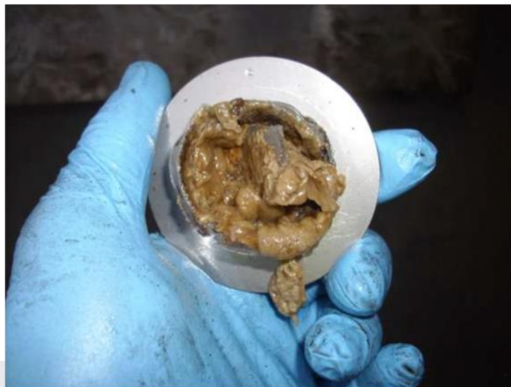
Foto: Voorbeeld micro-organismen in een filtersysteem.