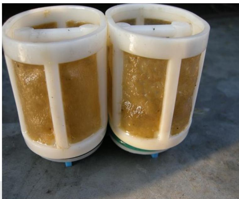
Foto: Voorbeeld verontreiniging filter met micro-organismen.

De inspectie-instelling kan ervoor kiezen het monster zelf te meten of dit te laten doen door een geaccrediteerd laboratorium.